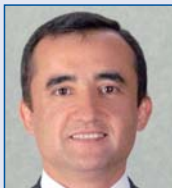
Kürşad Sait BABUÇCU Sermaye Piyasası Kurulu, Muhasebe Standartları Dairesi Başkanı