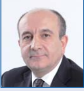
Işık GÖKKAYA GYODER Başkanı